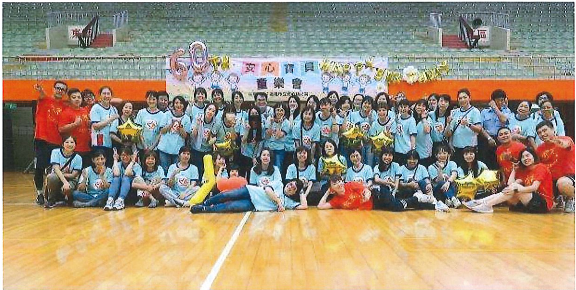
5. 畢業典禮:6/17(六)將於文化中心演藝議廳舉行畢業典禮。