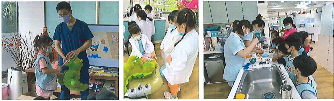
(4)小小生物觀察家:6/6(二)本園鋤形蟲班